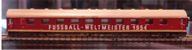
Erst dieser zusätzliche Mittelwagen 87720 macht den Eierkopf zum Weltmeisterzug von 1954.

Doch nur der Insiderzug kann sicher von sich behaupten, in zwei Epochen einsetzbar zu sein. Er kann die „wahren“ Fußball-Weltmeister in der frühen Epoche 3 heimfahren und auch die Schauspieler aus dem „Wunder von Bern“ oder Museumsfahrgäste der Epoche 5.