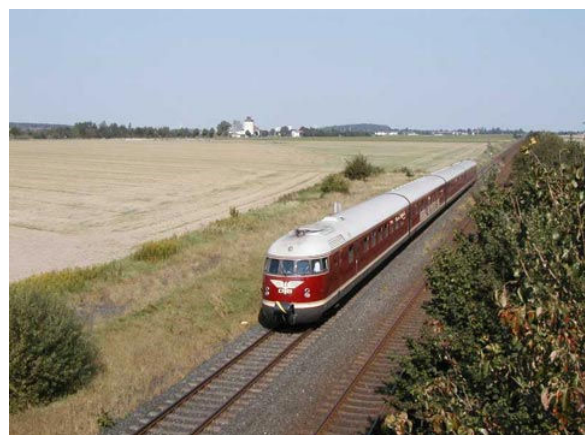
Hier ist die vierteilige Museumsgarnitur noch mal im Plandienst an alter Wirkungsstätte des norddeutschen Flachlands zu erleben.

Nur die Front wurde geringfügig geändert. Prangte bei Ablieferung noch das große DB-