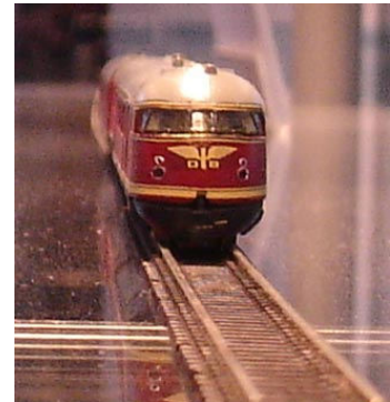
Das große Flügelrad zieht die Ursprungsvariante des VT 08.5.

Aber auch die fußballabstinenten Zetties müssen nicht auf die Ursprungsvariante mit dem großen DB-Flügelrad auf der Front verzichten: Der Zug wird den Märklin-Insidern unter der Artikelnummer 88720 als dreiteilige Grundeinheit mit fahrtrichtungsabhängigem Zwei-Licht-Spitzensignal und roter Schlussbeleuchtung angeboten. Unter der Artikelnummer 87720 ist ein zweiter Mittelwagen mit dem legendären Weltmeister-