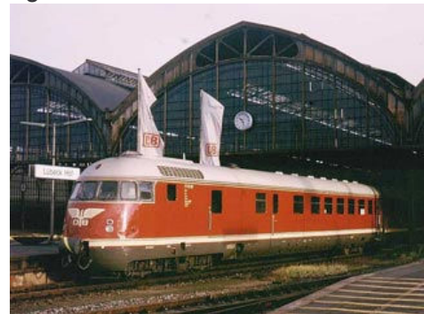
Auf dieser Aufnahme wird klar, wie der Spitzname „Eierkopf“ entstand. In Lübeck Hbf gehörte der Zug lange zum gewohnten Erscheinungsbild.

Die wirtschaftliche Bedeutung des Eierkopfes für die Deutsche Bundesbahn unterstreicht, dass fast alle bekannten Hersteller, die im Bereich Triebfahrzeug- und Waggonbau, Motoren- und Getriebetechnik sowie Elektrik für Schienenfahrzeuge zusammen mit dem Bundesbahnzentralamt München an der Entwicklung mitgewirkt haben. Angetrieben wird der VT 08.5 von einem 12-Zylinder-Motor in V-Form, der 1.000 PS leistete. Der auch aus der V100 und V200 bekannte Motor lagert mit allen Antriebsteilen und Getriebe im Maschinendrehgestell des Triebkopfes. Ein Wechsel ist daher leicht möglich, da nur das Drehgestell zu tauschen wäre.