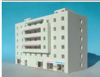
oben: Zeitungskiosk (73 212) unten: Wohnblock (73 260)