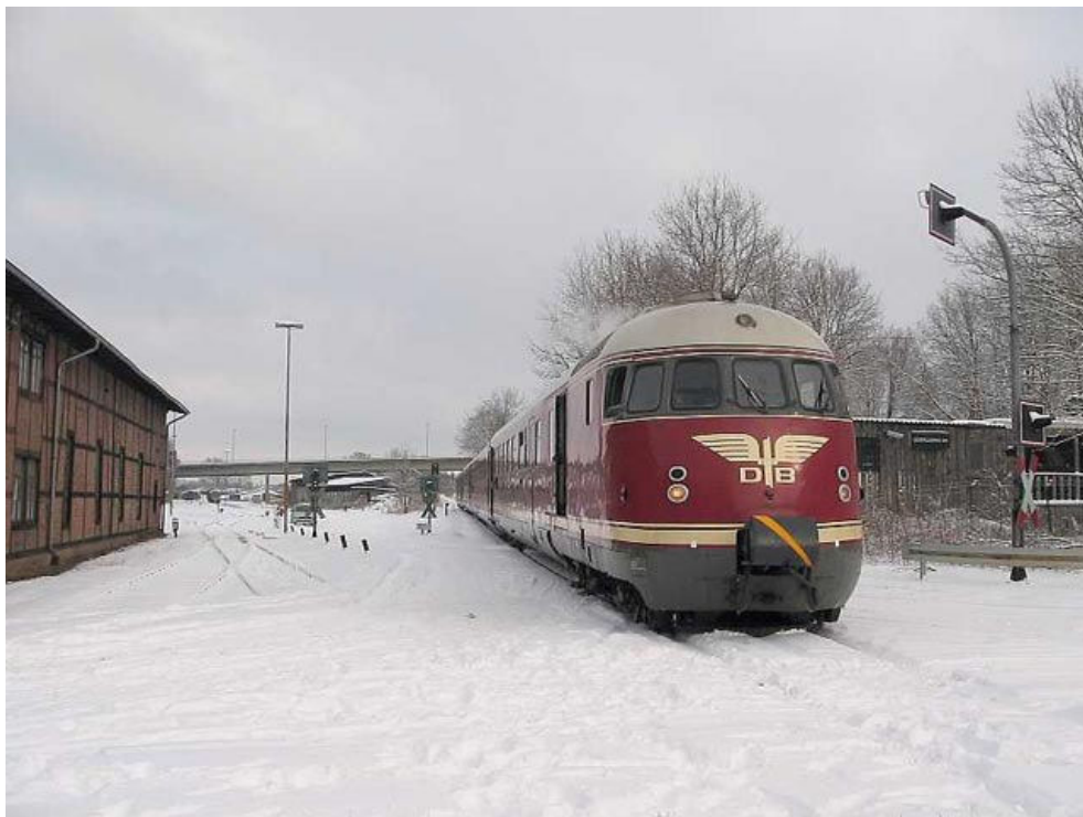
Passend zur Jahreszeit präsentiert sich die VT08-Garnitur im verschneiten Bahnhof Lüneburg OHE.

Während der äußerlich weitgehend identische VT 12.5 für den Bezirksschnellverkehr gedacht war und die „Volksversion“ der Triebwagen darstellte, sollte der VT 08 ausschließlich im prestigereichen Fernverkehr als Ft (Fernzug, triebzuggeführt) zum Einsatz