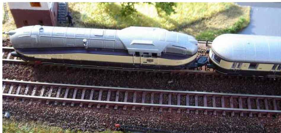
Auf der Anlage macht die elegante 61 001 mit dem Henschel-Wegmann-Zug eine gute Figur.