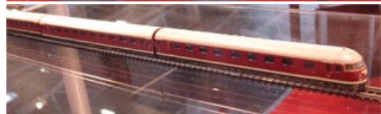
Ansichten des frisch enthüllten Handmusters zum Artikel 88720 für Spur Z: Motorwagen VT 08.5 (oben und Mitte) und Mittel- mit Steuerwagen VM + VS (unten).