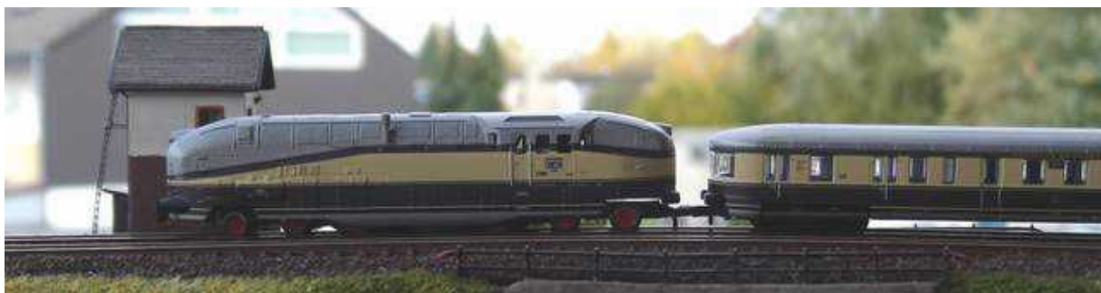
61 001 zieht mit der Henschel-Wegmann-Garnitur an einem Streckenposten in Brandenburg vorbei.

Webadressen: www.maerklin.de - Informationen zum Produktangebot inkl. Newsletter-Abo -