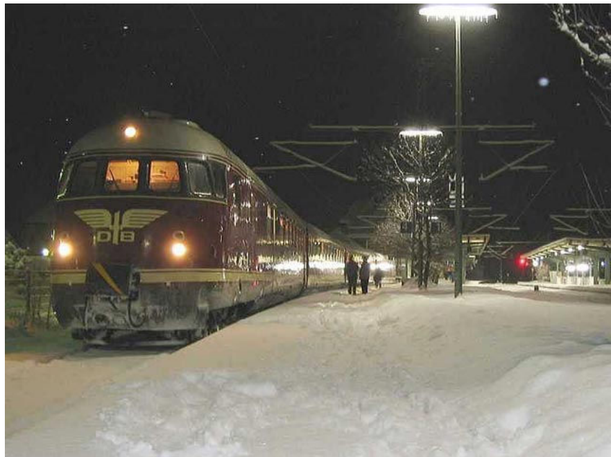
Stimmungsvolle Aufnahme im nächtlichen Schneetreiben: Der VT 08 am Titisee.

Auf einigen Strecken wurden mehrere Garnituren gekuppelt, teilweise sogar mit Altbau-Triebwagen. Dafür hatten sie von Anfang an die Scharfenbergkupplung erhalten. Mit dem „Schauinsland“ bespannten die VT 08 jahrelang bis zu Aufnahme des TEE-Verkehrs 1957 auch den schnellsten Zug der Bundesbahn, der mit 108 km/h Durchschnittsgeschwindigkeit verkehrte.