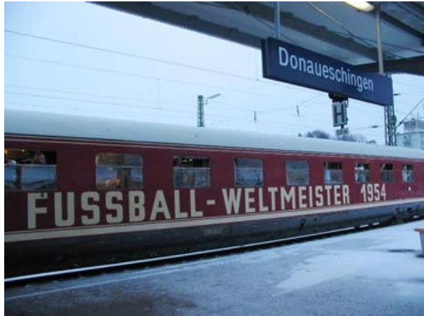
Für die Dreharbeiten zu „Das Wunder von Bern“ bekam die Museumsgarnitur wieder die historisch belegte Anschrift „Fussball-Weltmeister 1954“ verpasst. Hier zeigt sich die Garnitur in Donaueschingen.

1954 kam der VT 08 einmalig zu besonderen Ehren: Versehen mit einem großen Schriftzug „FUSSBALL-WELTMEISTER 1954“ fuhr eine Garnitur die deutsche Nationalmannschaft von Spiez nach München heim – die ganze Strecke umsäumt von hunderttausenden Fans.