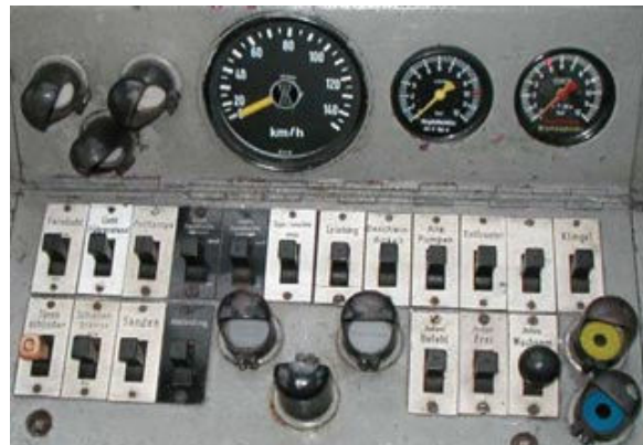
Bilder links und rechts:

So sah der Arbeitsplatz des Lokführers aus. Auf dem linken Bild zu erkennen sind u. a. der Fahrstufenschalter (links) und das Führerbremsventil (rechts). Auf dem rechten Bild sind rechts unten die drei Schalter der Indusi und die Kontrollleuchte der SiFa (rechts, blau) zu erkennen.