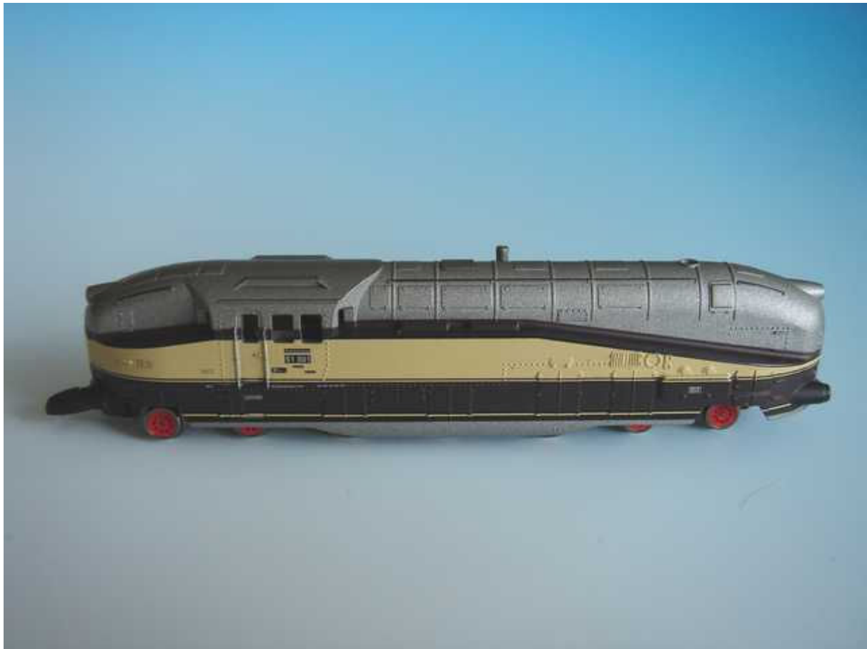
Gesamtansicht der Zuglok 61 001: Die an der ersten und letzten Laufachse ausgeschnittene Schürze ist kleineren Radien geschuldet, die ein Großserienmodell anstandslos befahren können muss.