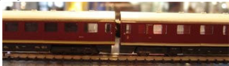
Das Handmuster ist extrem kurz gekuppelt und zeigt ein völlig neues Kupplungssystem für Spur-Z-Fahrzeuge.

Am optisch schon sehr ansprechenden Handmuster fällt auf, dass die Einheit extrem kurz gekuppelt ist. Vom Henschel-Wegmann-Zug wissen Zetties, dass der Göppinger Marktführer dies auch in der Serie gut umzusetzen weiß. Das Modell gewinnt dadurch erheblich.