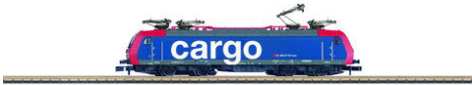
Re 482 für SBB Cargo (88482) – farbenfroher Ableger der Traxx-Familie von Bombardier.

Epoche 1 gehörende Set zeugt noch von der Blütezeit des Eisenbahn-Personenverkehrs in den Vereinigten Staaten und ist bei der Bahngesellschaft „Illinois Central“ angesiedelt.