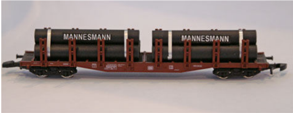
Ein früher alltägliches Ladegut: Mannesmann-Stahlröhren (Heico 22045 und 22046).

Erstauslieferung für Oktober vorgesehen ist. Einige Beladungen sind bereits in ähnlicher Form aus fremden Sortimenten bekannt: „Kupferröhren“ (Art.-Nrn. 22508 & 22509), „Stahlträger H-Profile“ (22012 & 22013) für jeweils zwei verschiedene Wagentypen, „Stahlbrammen, 3er-Set“ (22141) und „Sandsteinblöcke, 2er-Set“ (22612).