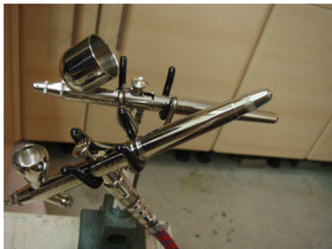
„Evolution Real“ im Vergleich mit dem Klassiker „Badger 100“: Die Farbzufuhrsysteme der neuen „Evolution Real“ sind deutlich flexibler und für jeden Bedarf anpassbar.

Als besonderes Bonbon steckt am Luftanschluss der Spritzpistole noch ein regulierbares Luftventil. Damit erübrigt sich der Griff zum Kompressor – mit einer Druckluftdose oder Luft aus einem Reifenschlauch sollte ein Gerät in Premium-Qualität nicht betrieben werden – während der Arbeitsgänge und man läuft nicht Gefahr, sich mal im Druckluftschlauch zu verheddern.