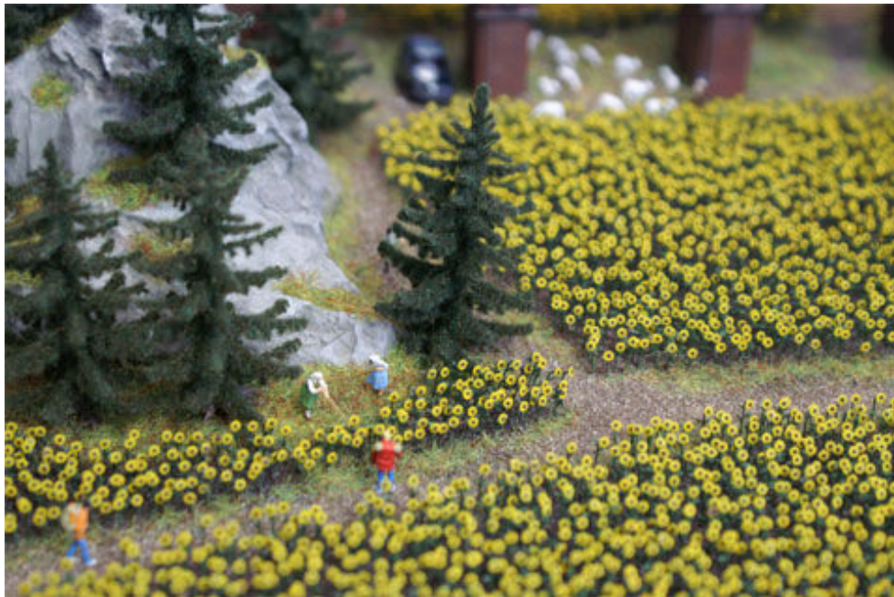
Fichten und Sonnenblumen von Busch: Für Spur N gedacht, lassen sie sich – im Falle der Sonnenblumen leicht gekürzt – durchaus auch für Spur Z verwenden.

Für Spurweite Z herstellerseitig vorgesehen sind allerdings folgende Artikel: Blütenbäume (Art.-Nr. 6813; 2 Stück), Obstbäume (6817; 2 Stück) und Buchen (6919; 3 Stück). Aber auch bei anderen Baumarten kann eventuell ein vergleichender Blick sinnvoll sein.