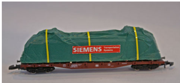
„Lokgehäuse unter Plane“: Heico 22001.

Magisch anziehend wirkt eine große, grüne Plane mit dem Logo von „Siemens“.