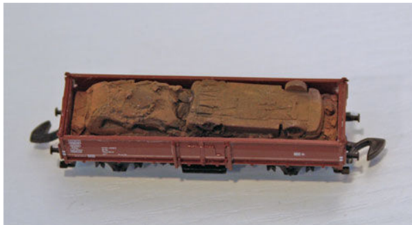
„Autoschrott“ von Ladegüter Bauer, Art.-Nr. Z0001