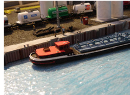
Beispiel für ein gesuchtes Fotomotiv. Die Verknüpfung mit der Bahn sollte so eng wie möglich sein.