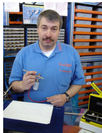
Vorführungspremiere auf der Intermodellbau 2005 in Dortmund.

Die innovative Idee der Evolution steckt aber am Ende des