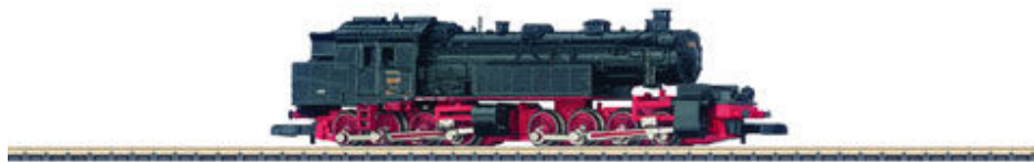
Baureihe 96 der Deutschen Reichsbahn. Epoche 2 (Art.-Nr. 88291).

Klasse statt Masse bestimmt die Neuheitenauswahl im Modelljahr 2006. Auffallend knapp ist allerdings trotzdem die Auswahl an Wagenmodellen – Formneuheiten sind da Fehlanzeige. Selbst die Insider müssen sich mit einem altbekanntem Stück (Grundmodell 8600) begnügen, dass als Migros-Ausführung von Interfrigo, eingestellt bei der SBB in Epoche 3, kommt (Art.-Nr. 80316). Wer einen Kühlwagen-Ganzzug zusammenstellen möchte, dürfte sich darüber aber sicher freuen.