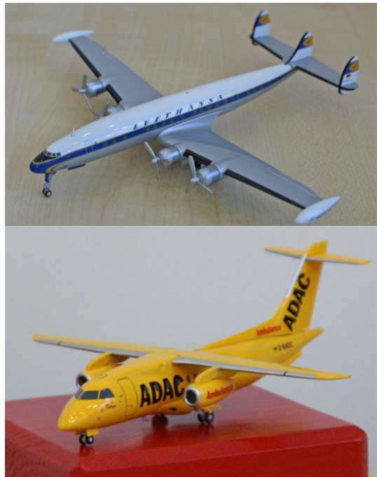
Oben: wuchtig – die „Super Constellation“.