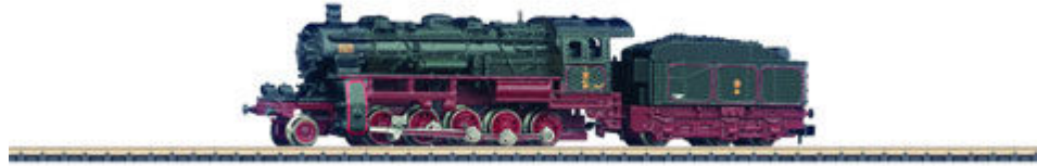
Preußische G12, Epoche 1 (88122).

kommt noch ein dreiteiliges Güterwagenset (Art.-Nr. 86618) mit Kessel- und Weinkühlwagen und einer weiteren G10-Variante der preußischen Staatsbahnen.