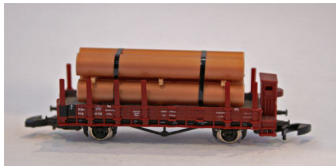
Ladegut „Kupferröhren“ von Heico (Art.-Nrn. 22508 und 22509).

Von Heico dürfen wir ganze 10 neue Ladegüter erwarten, deren