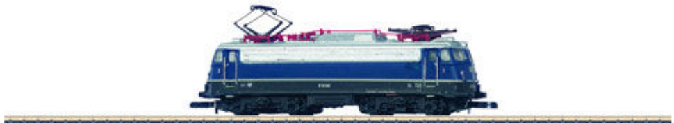
„Bügel falte“ E10.3 der Deutschen Bundesbahn mit Pufferverkleidung und durchgehendem Lüfterband, Epoche 3 (88411).

Verheißungsvoll klingt auch die Vorstellung des noch recht neuen E10.3-Modells „Bügel falte“ im stahlblau der frühen Epoche 3: Diese erstmals im Vorjahr erschienene Lok ist eine echte Formneuheit: Das neu konstruierte Gehäuse erhält eine elegante Pufferschürze, ein geändertes, durchgehendes Lüfterband der Ursprungsausführung und die Griffstangen am Führerhaus. Damit gibt Märklin die vielleicht formschönste, elektrische Neubaulok der DB ohne Abstriche konsequent wieder (Art.-Nr. 88411).