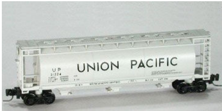
Cylindrical Covered Hopper im Maßstab 1:220.

Eine völlige Neukonstruktion ist der „ACF Center-Flow Cylindrical Covered Hopper“, der jeweils in Zweierpackungen angeboten wird (Art.-Nrn. WDW-1001 bis WDW-1005). Dieser Silowagentyp, der für nässeempfindliche Schüttgüter wie Getreide oder auch chemische Stoffe eingesetzt wurde und wird, erscheint für fünf verschiedene US-amerikanische Gesellschaften. Die Wagen innerhalb jedes Sets haben unterschiedliche Betriebsnummern.