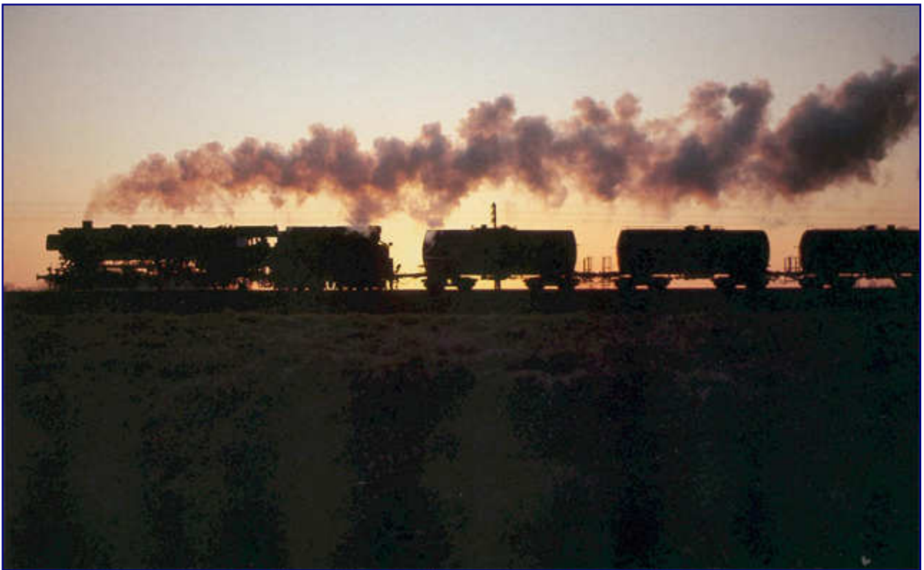
Einmalige Motive von der Emslandstrecke: 043 100-7 zieht bei Leschede mit dem Kesselwagenganzzug Gdg 66682 im Gegenlicht am Fotografen vorbei.

Die vielen Kühe, die uns aus geringer Entfernung beobachteten, grasten unbeirrt weiter, während wir uns in Position brachten und vor unserem VW Transporter warteten. Skeptischer blickten da die wenigen Einheimischen, die uns langhaarige Studenten im Vorbeifahren musterten. Wir führten nichts Böses im Schilde und ließen uns davon nicht beeindrucken. Unverständlich war es ja nicht: 1977 war auch das Jahr des „deutschen Herbstes“. Die RAF hatte Arbeitgeberpräsident Schleyer ermordet, Rasterfahndung war an der Tagesordnung und Deutschland befand sich im Ausnahmezustand.