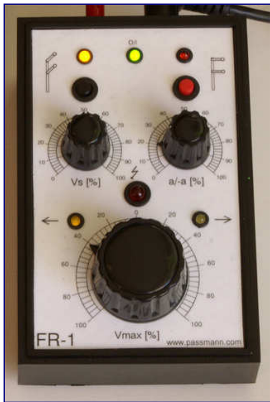
Die grüne LED signalisiert Betriebsbereitschaft. Der Rangiergang ist eingeschaltet (gelbe LED oben) und auf 50% eingeregelt. Damit regelt der große Drehknopf nur noch die Hälfte der Fahrspannung.

Aus Herstellersicht erklärt sich die zumindest für überschaubare Zeitintervalle festgestellte Toleranz der Pulsweitenmodulation durch Glockenankermotoren mit von zuvor gewohnten Impulsfahrgeräten abweichenden Eigenschaften. Kritisch seien nämlich nicht die Impulse an sich sondern Abreißfunken, die für Sekundenbruchteile extreme Ausreißer darstellen. Dieser Effekt konnte beim FR-1 wirksam entschärft werden, da die spitzen Zacken im Oszilloskop rechteckigen Verläufen gewichen sind.