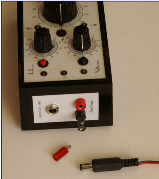
Ein Zwergstecker übernimmt den Spannungseingang am FR-1. Der Anschluss zu den Gleisen erfolgt über gewöhnliche Modellbahnstecker.

Dies ist deshalb besonders wichtig, da die verwendeten Beschriftungen nicht selbsterklärend sind. Um sich unabhängig von Sprachen zu machen, hat der Hersteller auf wissenschaftliche Abkürzungen zurückgegriffen, die international unter Fachleuten gebräuchlich sind. Es ist aber nicht jeder Modellbahner auch Physiker oder Elektriker und – ganz ehrlich – die Schulzeit liegt bei den meisten ja auch schon Jahre oder gar Jahrzehnte zurück.