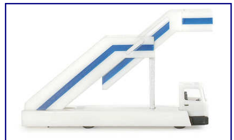
Selbstfahrende Fluggasttreppe (Art.-Nr. 551 793).