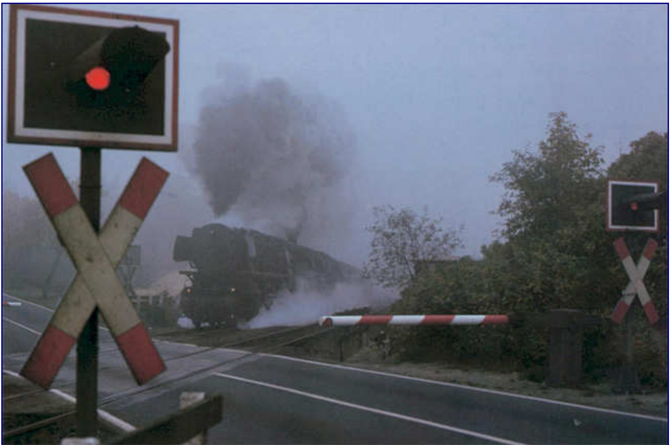
Das ersehnte Traumfoto: 043 087-6 und 043 321-9 tauchen am Blinklicht-Bahnübergang südlich von Lathen mit einem „Langen Heinrich“ aus dem Nebel auf.

Emslandstrecke. Doch selbst die ehemalige DB-Paradelok mit dem markanten „V“ auf der Haube, die noch die Erinnerung an das deutsche Wirtschaftswunder wach hielt, war uns Dampf Freunden in diesen