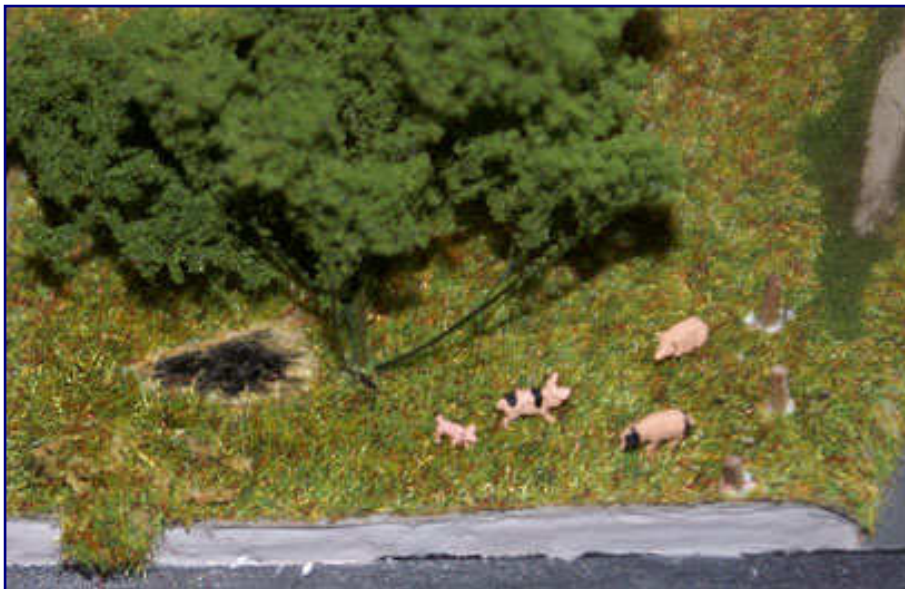
Nach kurzer Einwirkzeit lässt sich die mit Wasser getränkte Stelle der Geländematte von der Grundfläche abschieben. Die entstandene, kahle Stelle unter dem Baum wird zu einem Schlammloch für die Schweine umgestaltet.

Nun folgt die Lackierung: Der Mast, beim Vorbild aus Holz, erhält einen passenden Anstrich mit Revell 82 matt, die Traversen werden schwarz lackiert. Problematisch bleiben die runden Isolatoren, gilt es hier doch, Keramik nachzubilden. Auf einem Ätzbogen können sie zwangsläufig keine Dreidimensionalität erlangen, so dass diese Aufgabe dem Modellbahner bleibt.