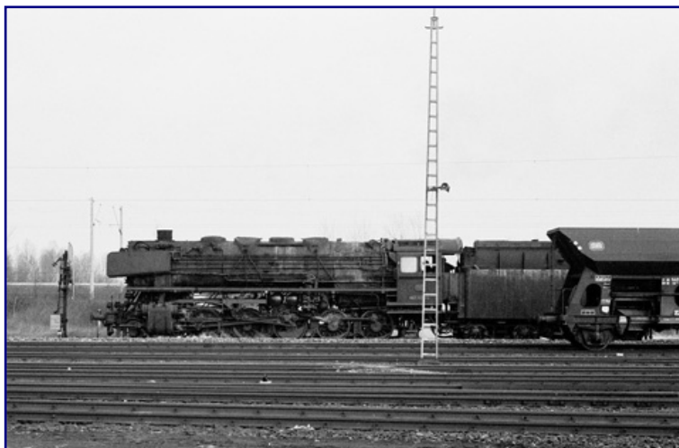
Im Ortsteil Hauenhorst wartet eine 043 abfahrbereit in Richtung Rheine. Der Dampfabschied ist großer Schwerpunkt der Fragen im Trainini Preisausschreiben 2007 .

Der zu verlosende Buchtitel wird in der Mai-Ausgabe vorgestellt.