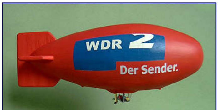
Zwei Beispiele für gelungene Leserarbeiten - die Entdeckung der Luft im Maßstab 1:220.