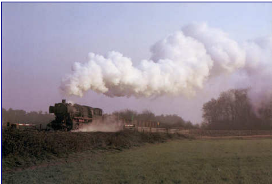
Bei Lokmangel waren auch Loks der Baureihe 50 noch lange vor leichten Güterzügen auf der Emslandstrecke zu sehen. 052 188-0 stößt eine lange, weiße Dampffahne in den frühen Morgenhimmel, als sie mit einem Leerpark Autotransportwagen kurz vor Lingen fotografiert wird.

Emslandstrecke. Doch selbst die ehemalige DB-Paradelok mit dem markanten „V“ auf der Haube, die noch die Erinnerung an das deutsche Wirtschaftswunder wach hielt, war uns Dampf Freunden in diesen