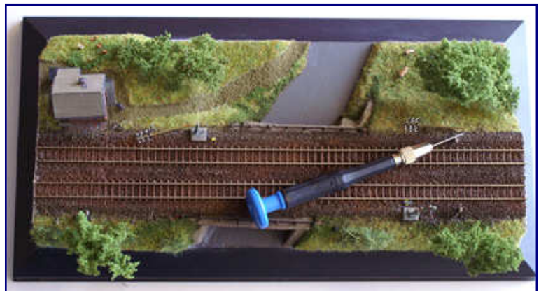
Für die neu zu platzierenden Gestaltungselemente sind die Standorte festzulegen und Bohrungen anzubringen. Doch noch befindet sich das Diorama im Ausgangszustand aus Teil dieser Serie.

Auf ähnliche Weise fanden die Schweine, wegen ihrer Größe aus einer Spur-N-Packung von Noch (Art.-Nr. 36712) ausgesuchte Exemplare, ihren Weg auf das Ausstellungsstück. Die Wiese links der Straße im Vordergrund bot sich wegen des hohen Graswuchses geradezu als Weidefläche an. Typisch und einsetzbar für eine solche in den siebziger Jahren angesiedelte Szenerie sind allerdings auch Kühe.