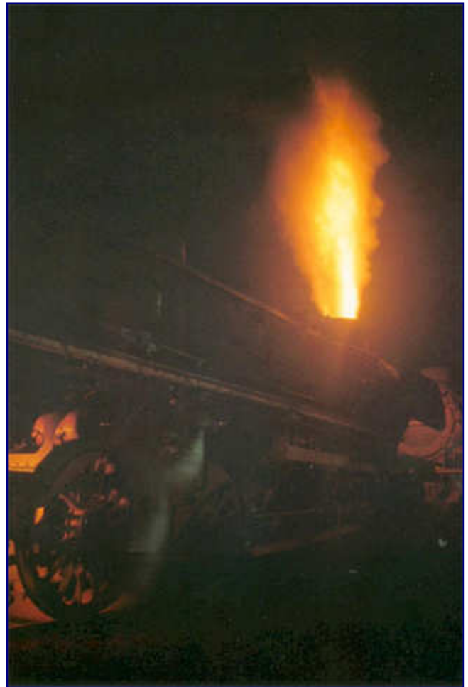
Eine lange Flamme schießt über 042 360-8 in den Himmel, als nach dem Abstellen der Brenner die Leitungen ausgeblasen werden – ein beliebtes Fotomotiv bei Dampffreunden.

Kantige, alte Elektrolokomotiven, die längst keinen technischen Fortschritt mehr verkörperten und die runde, rote V 200 waren nach dem Ende der Dampfära noch für einige Jahre der Alltag auf der