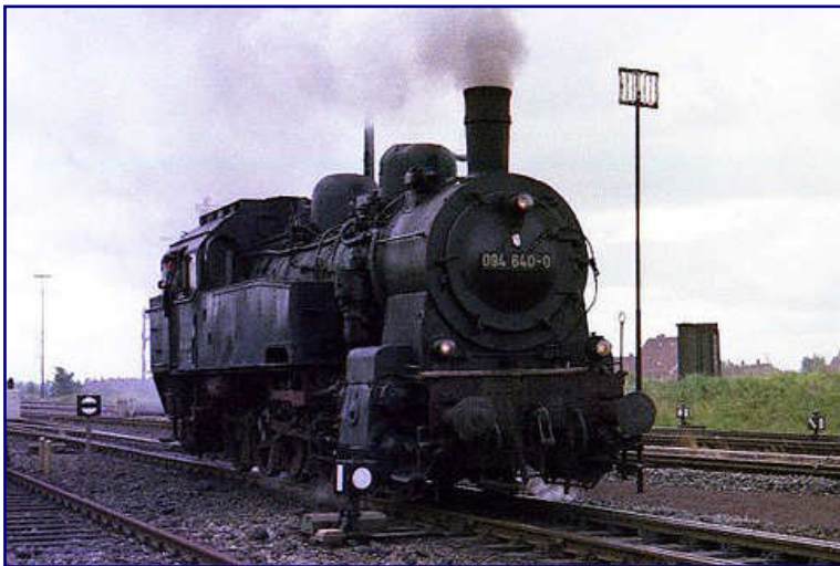
Im Juli 1974 stand die ehemalige, preußische Vershublok 094 640-0 noch in Emden unter Dampf.

Meine erste Leidenschaft galt den letzten Dampflokomotiven der guten alten „Beamtenbahn“. Gefallen hatten sie mir immer und so drehten einige von ihnen auch ihre Kreise auf meiner Märklin-Platte, ein liebgewonnenes Spielzeug aus Kindertagen, das in Zeiten wachsenden Wohlstands geradezu zur Pflicht in deutschen Kinderzimmern gehörte.