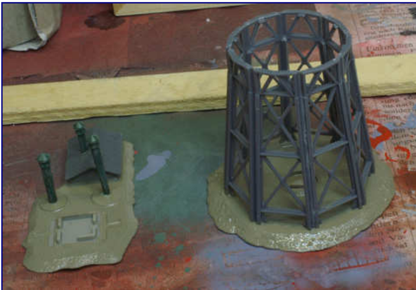
Das Stahlgerüst wird mit Revell 78 matt (eisengrau) grundlackiert. Die noch vom frischen Lack glänzenden Bodenplatten erhielten einen Anstrich in Erdfarbe (Revell 87 matt).

Die Türen zum Treppenaufgang im Inneren der „Mittelsäule“ und von dort auf den Übergang zum Kugelaufstieg erhielten eine schwarze Lackierung (Revell 8 matt). Das gleiche gilt für das Zwischenstück, das später den Übergang vom Wasserbehälter zur Turmspitze bilden wird.