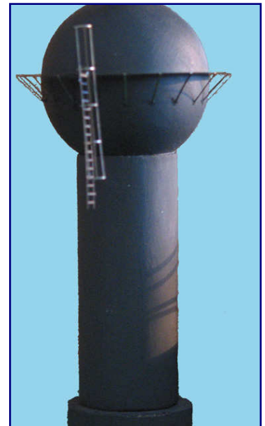
Der ursprüngliche Wasserturm in einem frühen Baustadium inspirierte wegen seiner feinen Leitern und Geländer zur Neuentwicklung.

Als Urheber der Idee fiel mir die Rolle zu, einen geeigneten Wasserturm zu finden. In Frage kamen nur noch Sortimente der Spurweite N. Fündig wurde ich schließlich bei Faller: Der dort unter der Artikelnummer 222 143 angebotene „Wasserturm Haltingen“ ist nicht einfach nur eine typische Konstruktion auf einem Stahlgerüst, sondern er erwies sich auch in der Größe als ideal.