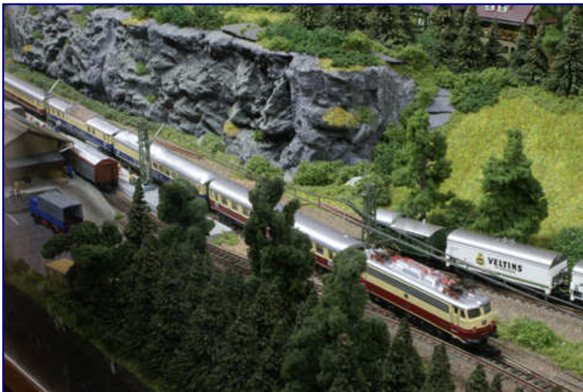
In der Übergangszeit fährt der nun als TEE verkehrende „Rheinpfeil“ (Märklin 81439) im gemischten Farbkleid. Lok und einige Wagen tragen bereits die TEE-Farben bordeauxrot-beige, während Aussichts- und Buckelspeisewagen noch im FD-Farbkleid unterwegs sind. Das Foto dieser Märklin-Neuheit wurde beim Stammtisch Untereschbach aufgenommen.

Da Märklins unverbindliche Preisempfehlung deutlich über dem Doppelten liegt, was 1994 im Fachhandel für das vergleichbare Vorgängermodell zu zahlen war, wäre dieser Aufwand aus Kundensicht