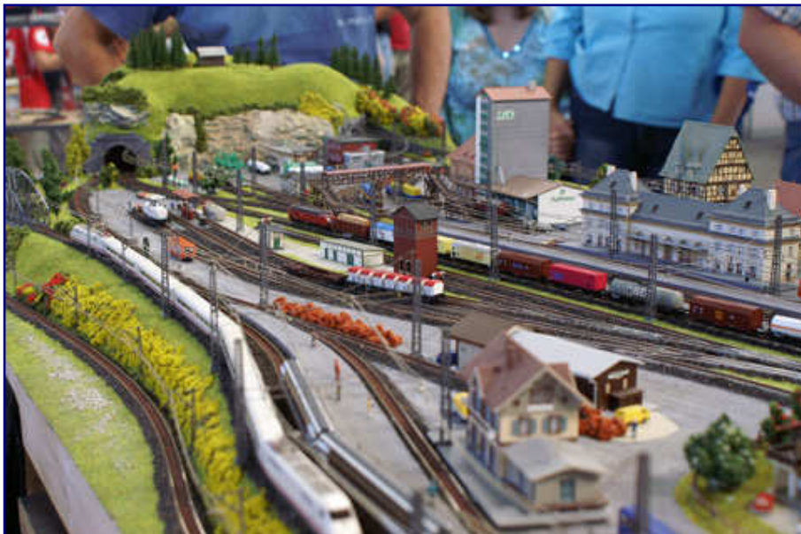
Zu den wenigen Exponaten in der Spurweite Z gehörte diese Anlage des Modellbahn-Stammtisches Stuttgart, auf der moderner Schienen- und Straßenverkehr gezeigt wurde. So befindet sich der IC-Experimental (Baureihe 410) gerade auf einer Testfahrt.

Wieder draußen, widmeten wir uns noch den Vorbildmaschinen. Ließ die zu Führerstandsmittfahrten einladende 01 5 der ÖGEG vor allem die Herzen der DR-Freunde höher schlagen, fanden Anhänger der DB Vergleichbares in der 01 1081. Lokomotiven der Baureihen V 60, 103, 182 (Taurus), ein deutsches Krokodil E 94 und die 01 066 rundeten das klassische Märklin-Programm im Vorbild ab.