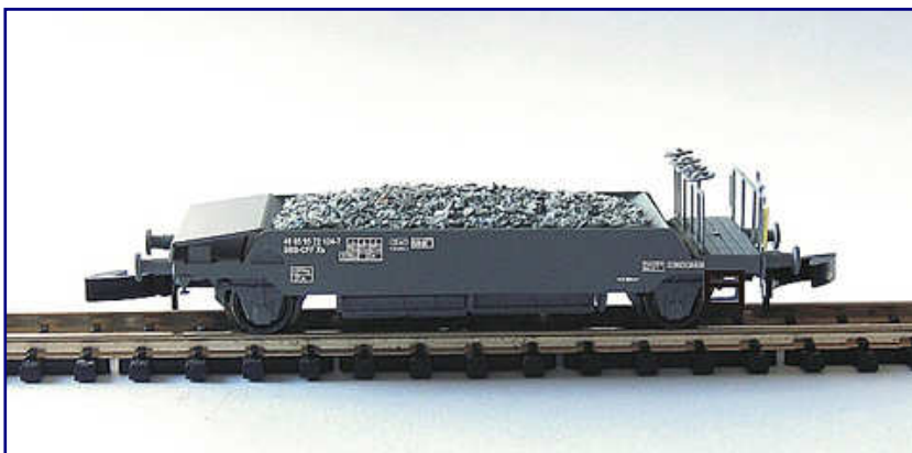
Der Neuschotterwagen Xs72 der SBB von Freudenreich Feinwerktechnik glänzt mit feinsten Detailnachbildungen.