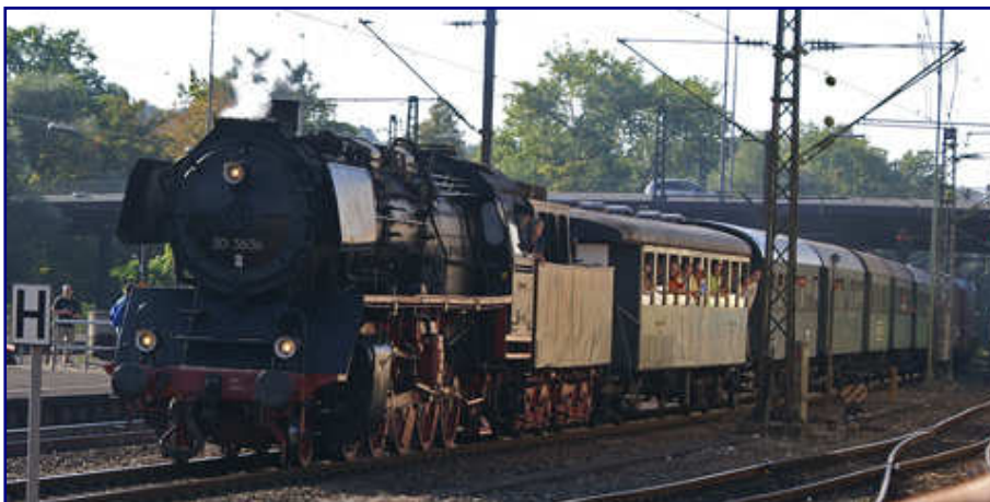
Auf Wiedersehen! Die Reko-Lok der Baureihe 50 35 aus dem Bestand der ehemaligen Deutschen Reichsbahn der DDR dampft am frühen Sonntag Abend mit ihrem Zug wieder aus Göppingen ab.

Obwohl fast zwei Jahre Vorlaufzeit bestanden, wirkten viele Programmpunkte zudem recht improvisiert. Dazu gehört der Güterschuppen, der keine „Messeatmosphäre“ aufkommen lassen will wie auch das