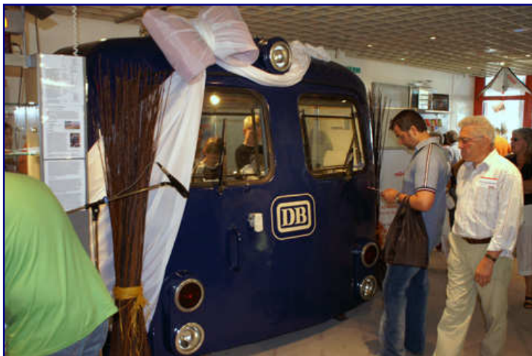
Das waren die Attraktionen der Erlebniswelt zu den Märklin-Tagen 2007: historische Löschfahrzeuge der Feuerwehr Göppingen (oben), kleine Spur-Z-Dioramen im Bilderrahmen (Mitte) und der lange zuvor angekündigte Führerstand einer Lok der Baureihe 110 (unten).

Nachdem man mit dem Märklin-Familientag in der jüngeren Vergangenheit noch ein weiteres Großereignis etabliert hatte, lag es betriebswirtschaftlich nahe, beides sinnvoll zusammenzuführen. Dass dies nicht auf Anhieb reibungslos und ohne jedes Problem geklappt hat, mag man dem Veranstalter nachsehen und entschuldigen, denn wer familiär gebunden ist, wird durch diese Koppelung eher den Weg nach Göppingen finden als zum Modellbahntreff allein. Insofern darf man durchaus beiderseitiges Interesse voraussetzen.