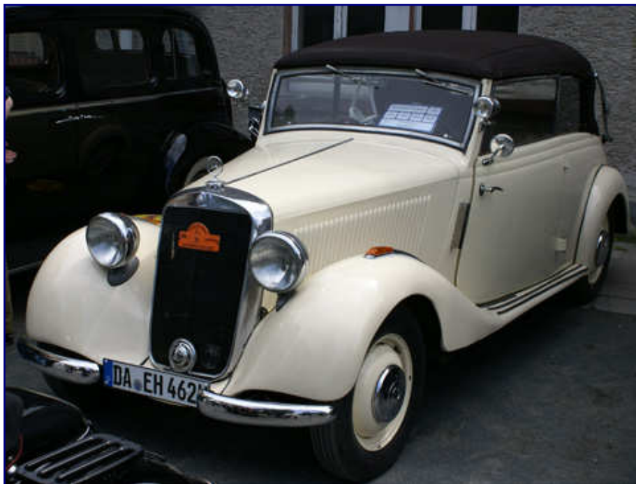
Der Mercedes 170 bildete den Abschluss der zivilen Automobilentwicklung bei Daimler-Benz vor dem 2. Weltkrieg und markierte auch den Neubeginn der Auto-Entwicklung. Daher durfte er auch im Sortiment von MWB nicht fehlen. Alle hier abgebildeten, historischen Automobile gehören zum Arheilger Oldtimer-Stammtisch.

Wenn Lösemittel oder Wasser sich verflüchtigen, geht mit ihnen auch Masse in geringem, aber nachweisbarem Umfang verloren. Die Kunst beim Modell lautet daher, deren Umfang exakt von vornherein einzuplanen, damit am Ende alles passt. Und hier versteht MWB sein Handwerk, wenn die Herstellerangaben zutreffen.