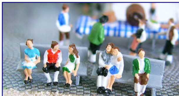
Drei der Trafofuchs-Neuheiten auf einen Blick: Set „Blumen“ für Epoche 1 (oben), „Reisende 21“ für Epoche 5 (Mitte) und die Trachtenfiguren-Set „Sitzende“ zur Gestaltung bayerischer Biergärten und Volksfeste (unten).