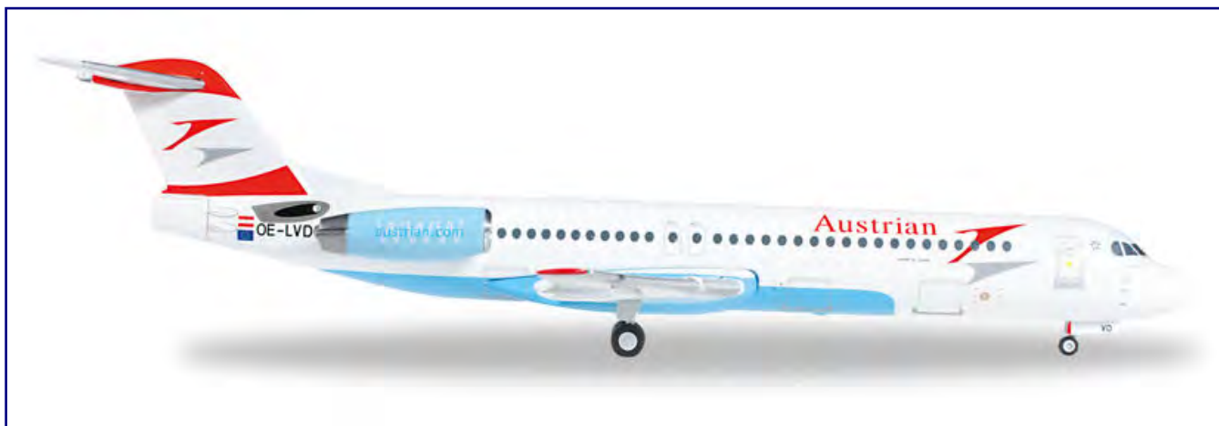
Brussels Airlines Airbus A320 „Red Devils“ (Art.-Nr. 556446; Bild oben) und Austrian Airlines Fokker 100 (557719; Bild unten) sind zwei der für März und April 2016 angekündigten Neuheiten.

Bei den Snapfit-Modellen halten wir einzig den Airbus A320 der Edelweiss Air (610940) in den neuen Farben des Jahres 2016 in seinen Maßen für anlagentauglich.