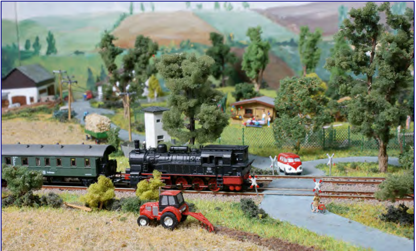
Auf der neuen Vorführanlage von Trafofuchs gibt es viele Figurenszenen zu sehen. Im Hintergrund findet in der Schrebergartenanlage ein Kindergeburtstag statt. Auch der Traktor im Vordergrund stammt aus dem eigenen Programm.