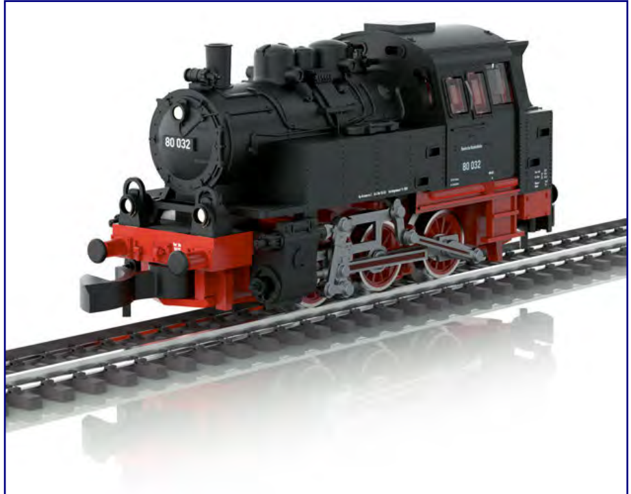
Die Volumendarstellung aus dem CAD-Programm zeigt eine Lok mit vielen feinen Merkmalen wie Nieten am Wasserkasten. Ein paar Kleinigkeiten lassen sich aber hoffentlich noch ergänzen.

Wünschenswert wären auch längere Kolbenstangenschutzrohre, die durch die Tritte hindurchreichen.