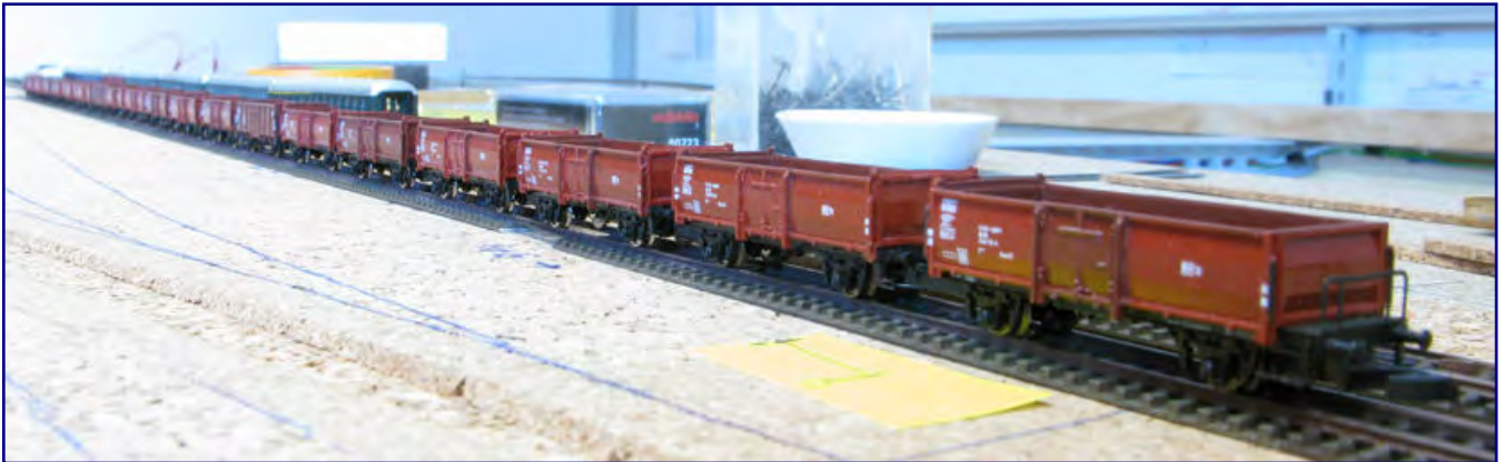
Einen langen Ganzzug bilden die offenen Güterwagen Omm 52 mit und ohne Bremserbühne, die nach ihrem Umbau in jeder Hinsicht stimmig sind.

Mit fünf eingereichten Beiträgen war Dirk Rohwerder der aktivste unter allen Teilnehmern unseres Umbauwettbewerbs. Mit großer Schaffenskraft und ebenso bewiesener Kreativität hatte er entscheidenden Anteil an dessen Anliegen. Sein fünftes und letztes Projekt stellen wir nun an dieser Stelle vor: den offenen Güterwagen Omm 52 aus dem Neubauprogramm der Deutschen Bundesbahn.