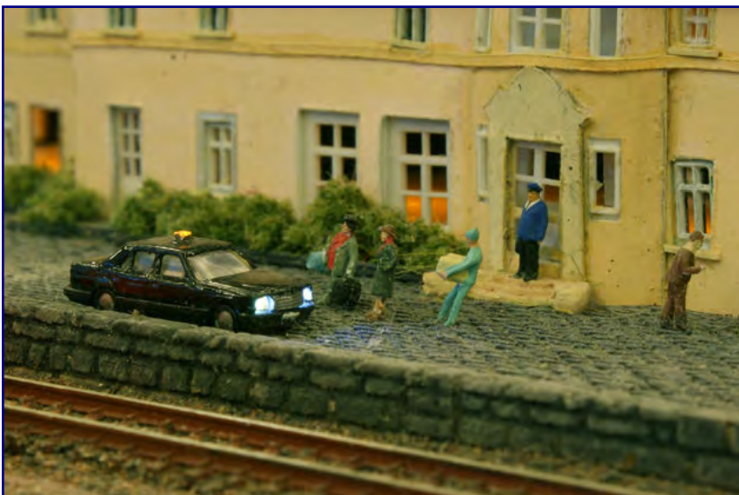
Gerhard Maurer hatte auf seinen Modulen für zusätzliche Beleuchtung gesorgt. Neben Scheinwerfern und Rücklichtern leuchten an den Taxis auch die Schilder.

Die Eheleute Küpper (Spur Z Ladegut Josephine Küpper) hatten ihr reiches Angebot an gebrauchten Modellbahnartikeln sowie Ladegütern dabei.