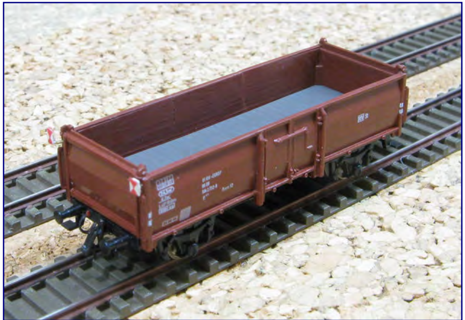
Den Wagenboden bedecken geätzte und lackierte Bleche, die noch für etwas zusätzliches Gewicht sorgen. Der Schlusswagen erhielt zusätzlich eine komplette Pufferbohlenaus-rüstung und Zugschluss-signale in Tagesausführung, montiert an Haltern in korrekter Lage. Mit ihnen auch dieser Beitragsreihe!

http://www.maerklin.de http://www.fohrmann.com http://www.hecklkleinserien.de http://www.kuswa.de http://weinert-modellbau.de