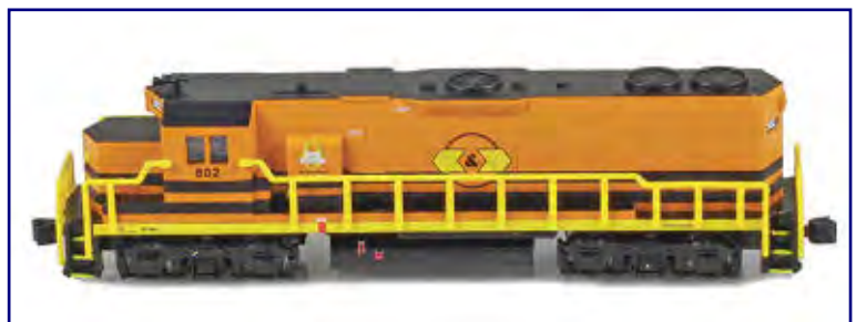
Die EMD GP38-2 erscheint jetzt in den Farben der GW.

Auch eine weitere Version der EMD E8 A ist nun ausgeliefert worden: Zwischen zwei Betriebsnummern für die Illinois Central (62612-1 / -2) kann der Kunde wählen. Drei sind es bei der EMD GP38-2 (62523-1 bis -3), die in den Farben der Genesee & Wyoming ins Programm zurückkehrt.