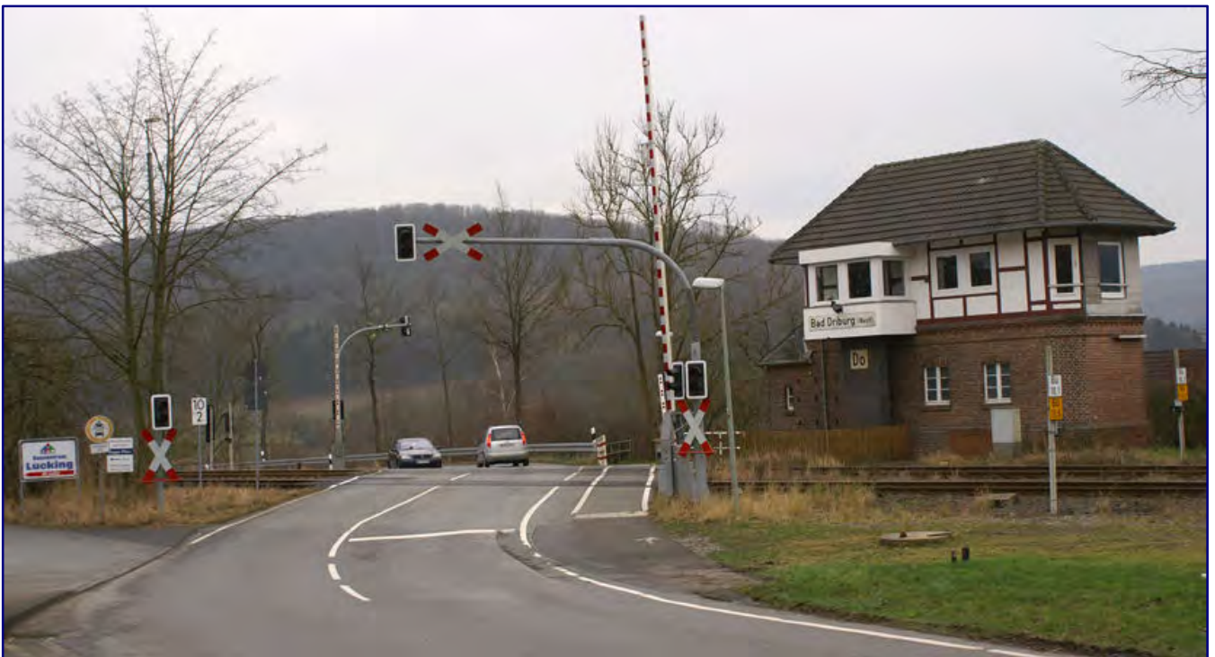
Modell im Zustand von 1975 (Bild oben) und Original im Jahre 2015 (Bild unten): Der Bahnübergang am Ortseingang von Bad Driburg ist auf der Schauanlage ebenfalls bis ins kleinste Detail nachgebildet worden.

An den Start ging die Ausstellung einst unter dem Kürzel „MO187“, wurde später jedoch in den bis heute gültigen und gängigeren Namen Modellbundesbahn umgetauft. Gewachsen ist die Schauanlage seitdem, neue Funktionen hat sie bekommen, die Umsatzsteuer wurde ebenso wie die Energiepreise erhöht.