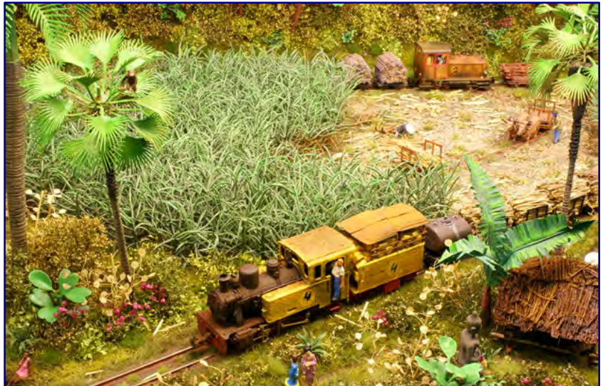
Die Anlage „Pabrik Gula Jairuba“ von Diger Rossel orientierte sich an Motiven aus Indonesien. Typisch für die Zuckerrohrbahn waren unter anderem die vielen Affen, die überall in den Bäumen sitzen.

Sie wurden beim Publikum als vollwertig akzeptiert und sehr ausgiebig in allen Details beobachtet. Die durchschnittliche Verweildauer dürfte sich durchaus in Richtung einer Viertelstunde bewegt haben.