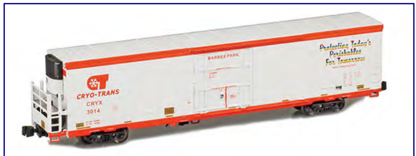
64-Fuß-Maschinenkühlwagen in den Farben von Cyro-Trans (CRYX).

Die 64'-Maschinenkühlwagen zeigen zum Weiß nun auch Farbe und tragen Anschriften der CRYX. Mit zwei verschiedenen Klimaanlageausführungen sind diese Güterwagen in zwei Vierer- (904008-1 / -2) oder einer Zwölferzusammenstellung (904009-1) verpackt sowie einzeln erhältlich (914008-1 / -2 und 914009-1 / -2).