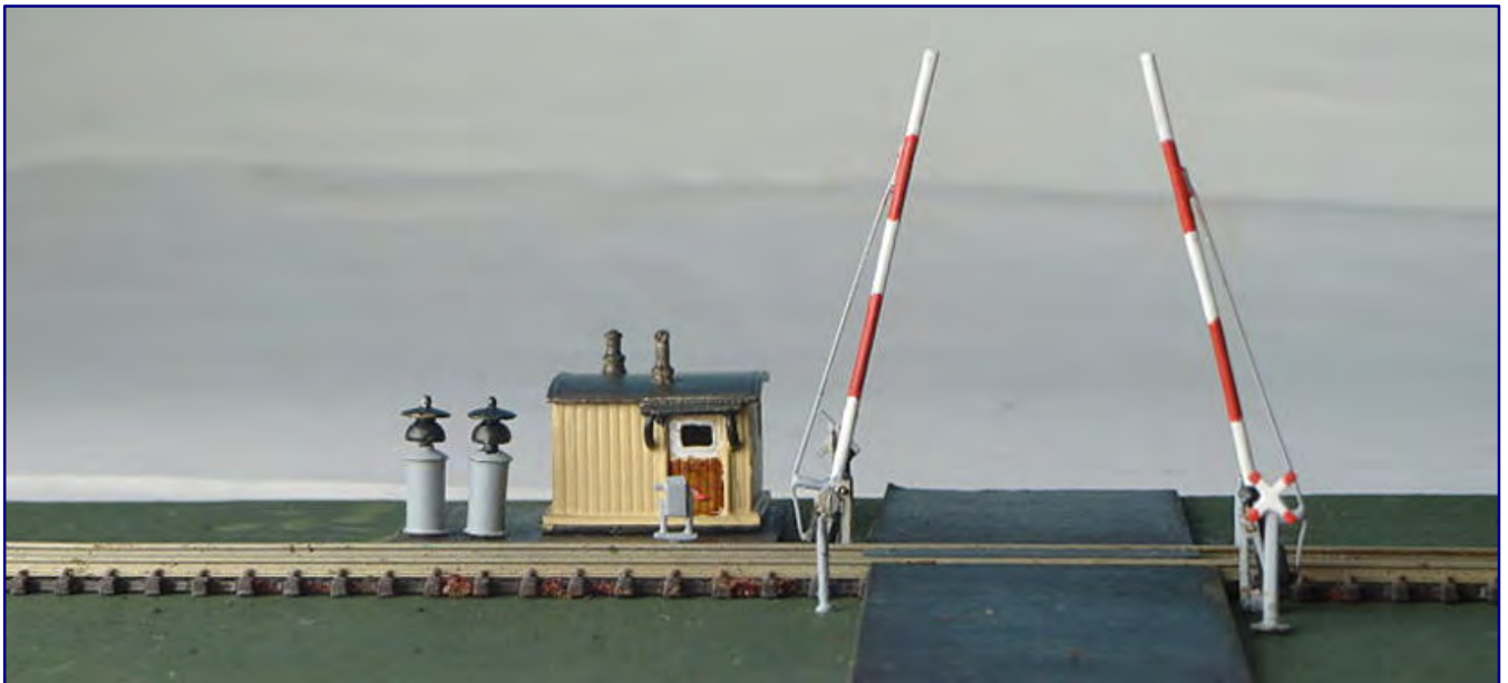
Der neue Schrankenposten (Art.-Nr. 40033) von Westmodel füllt eine Sortimentslücke in der Spurweite Z. Auf Wunsch kann er natürlich auch abgewandelt eingesetzt werden, denn für die Wärterbude ließe sich bei Bedarf auch ein anderer Standort finden. Gleiches gilt für die Lätewerke.

Ebenfalls erhältlich ist der Umbausatz für Märklins Baureihe 18 4 zu einer Lok der Nachbauserie 18 5 (40034), bestehend aus den Gussteilen für Führerhaus und Kohlenkastenaufsatz sowie passenden Beschriftungssätzen für die Einsatzepochen des Vorbilds.