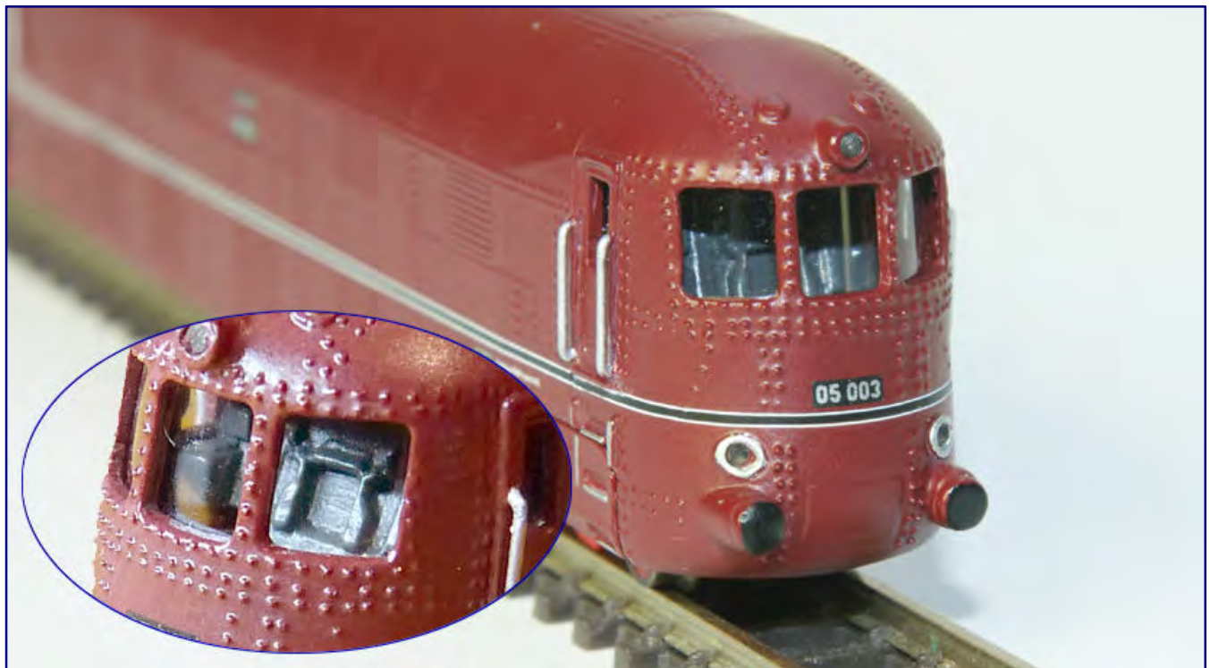
Die Führerstandseinrichtung wird nur bei gezielter Ausleuchtung von außen sichtbar. Zweifel bleiben, ob die Öffnung zur Feuerbüchse wirklich der Bauart Marcotty entsprach (zu sehen im Außenfenster des Bildausschnitts). Vergessen wurde auf jeden Fall das Handrad der Steuerung, das im Hauptbild auf der Lokführerseite ins Stirnfenster ragen müsste.

Mangels Farbfotografien lassen sich diese Annahmen nicht abschließend be- oder widerlegen. Hinzukommt, dass Aufnahmen damals häufig auch noch retuschiert wurden. Einen sicheren Beleg bleibt insofern auch der Autor selbst schuldig.