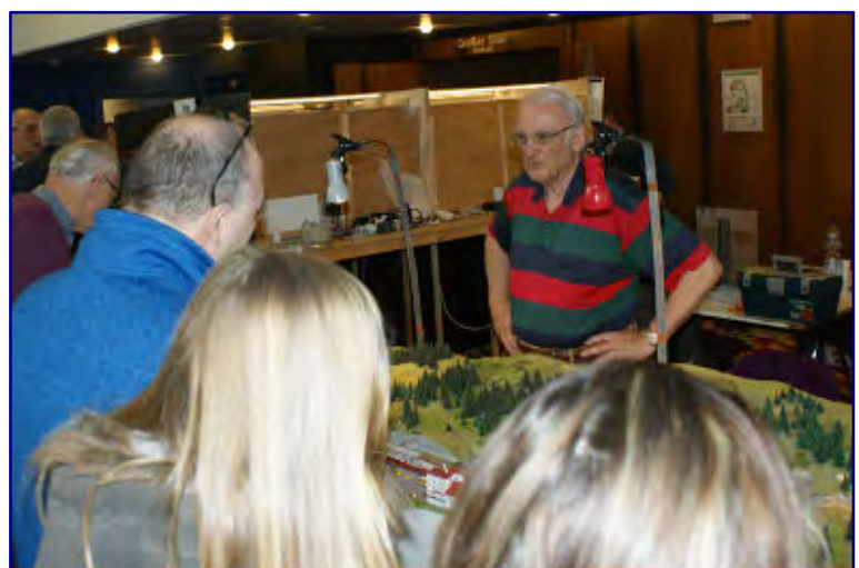
Die Spur-Z-Anlagen erfreuten sich in Lahnstein immer eines großen Besucherzustroms. Dabei wurde viel fotografiert (Bild oben) und gern mit den Anlagenerbauern gefachsimpelt (Bild unten).