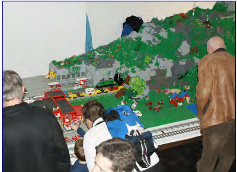
Ein Besuchermagnet nicht nur für die Kleinsten war die Lego-Eisenbahn, wie dieses Bild beweist. Viele Gäste hatten keine Vorstellung davon, wie mit Legosteinen ein Berg mit Tunnel gestaltet werden kann.

Bevor ich auf die drei vertretenen Spur-Z-Anlagen eingehe, seien Krüger Modellbau in einem Nebenraum und die vielen Gebrauchtgüterhändler im großen Saal nicht vergessen. Auch für Zetties sollte sich das Stöbern nach „alten Schätzchen“ durchaus gelohnt haben, denn hier war durchaus einiges zu finden. Auch die Preise erschienen dabei marktgerecht.