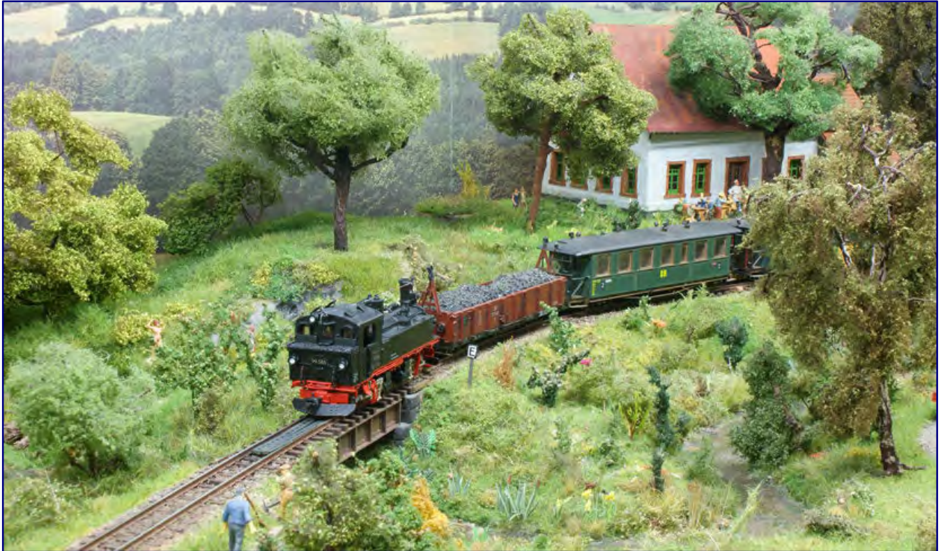
Ilona und Bernd Rüger haben die sächsische Schmalspurbahn rund um Dorfchemnitz zu DDR-Zeiten als Vorbild für ihre Anlage (Spur H0e) genommen und deren Motive meisterhaft umgesetzt.

Einige der in Lahnstein gezeigten Anlagen größerer Spurweiten seien an dieser Stelle kurz vorgestellt, da sie den Anspruch der Ausstellung unterstreichen und mir als repräsentativer Querschnitt der Motivvielfalt geeignet erscheinen.