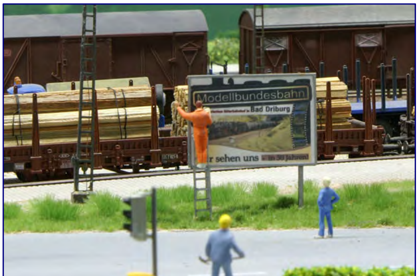
Im historischen Güterschuppen Bad Driburg (Bild oben) präsentiert sich die Modellbundesbahn – mit ausreichend Parkplätzen direkt vor der Tür. Humorvoll wird auf der Anlage an entsprechender Stätte auch mit einem Werbeplakat (Bild unten) auf den Schuppen hingewiesen: „Wir sehen uns in 30 Jahren!“