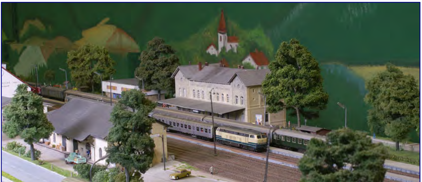
Wer mit der Bahn anreist, steigt in Bad Driburg aus. Der Bahnhof hat sein Aussehen bis heute nur wenig verändert, das historische Empfangsgebäude ist nahezu unverändert erhalten geblieben. Vorne links im Bild ist der Güterschuppen zu sehen, in dem heute die Modellbundesbahn untergebracht ist.

So kommt es immer wieder vor, dass der Großvater mit seinen Enkeln vorbeischaud und die Abläufe in seinem früheren Betriebswerk erklärt oder gar Wohnhaus oder Ausbildungsstätte seiner Jugend wiedererkennt. Einen eindeutigeren Beleg für die Authentizität dieser Anlage kann es nicht geben!